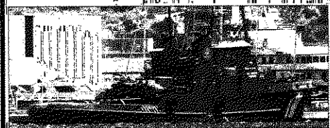
El «VB Antártico» (foto de archivo)

España presidirá el Foro Internacional del Transporte en Leipzig